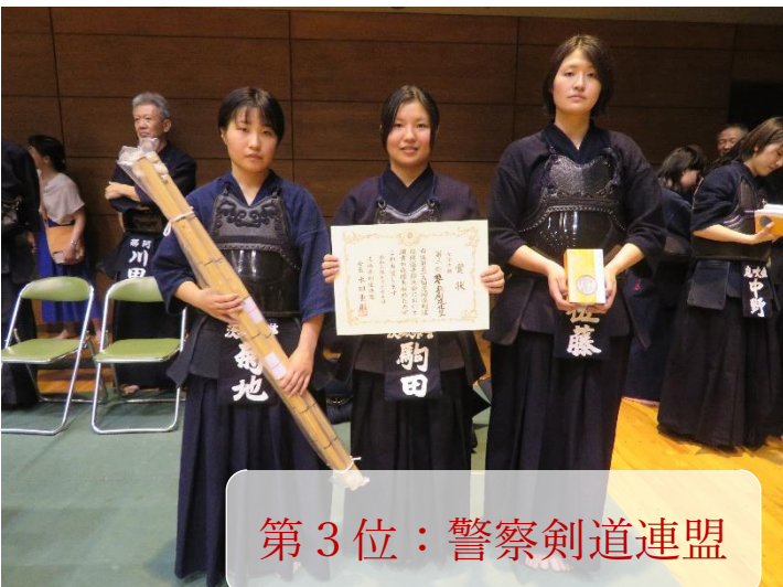
第3位：警察剣道連盟