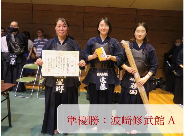
準優勝：波崎修武館A