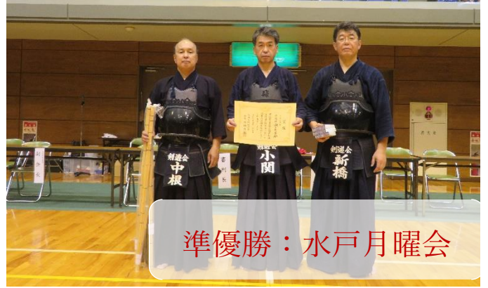
準優勝：水戸月曜会